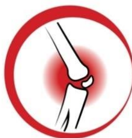
DURERI ARTICULARE INTENSE